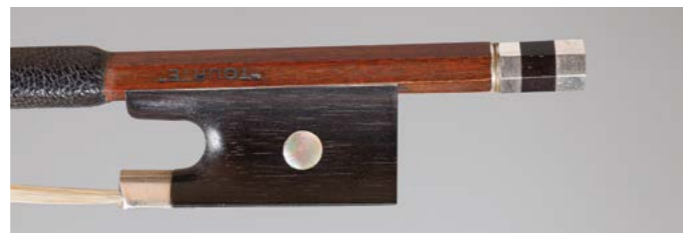
N° 43 Archet de violon d'Emille Auguste OUCHARD Fils Fait vers 1925, signé « Tourte », monté argent. 61g5. Très bon état.