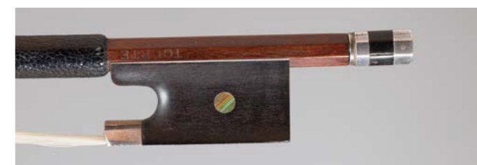
N° 25 Archet de violon de CUNIoT HURY/OUCHARD Fait vers 1905, signé « Tourte », monté argent. 62g. Bon état.