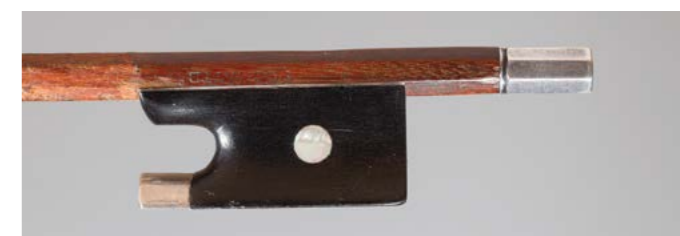
N° 3 Archet de violon de Charles-François PECCATTE Fait vers 1890, signé « Peccatte », monté argent. 52g8. Bon état.