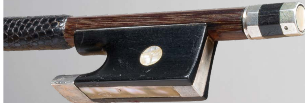
N° 33 Très bel archet de violon de François PECCATTE Fait vers 1845-1850, signé « Peccatte », monté argent. 55g5. Très bon état. Figure dans le livre « L'Archet », tome II, page 261, n° 10.