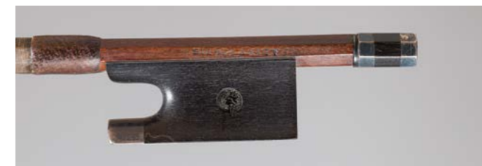
N° 23 Bel archet de violon de Georges Léon LAMY Fils Fait vers 1910, signé « A. Lamy à Paris », monté argent. 51g3. Très bon état.