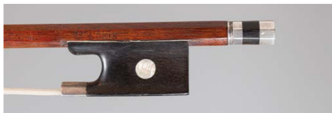
N° 10 Très bel archet de violon de Nicolas SIMON dit SIMON FR Fait vers 1850, signé « Simon Fr », monté argent. 53g6. Bon état. Figure dans le livre « L'Archet », tome II, page 160, n° 4.