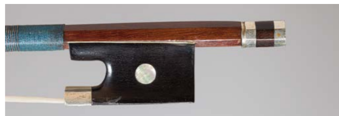
N° 44 Archet de violon de l'atelier de Dominique PECCATTE Fait vers 1865, en bois d'abeille, monté maillechort. 58g5. Bon état. Figure dans le livre « L'Archet », tome II, page 224, n° 32.