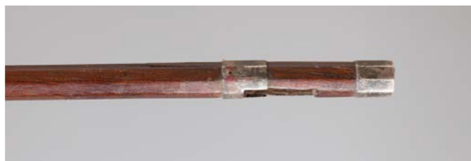
N° 6 Belle baguette d'archet de violon de Nicolas Léonard TOURTE Fait vers 1795-1800. 39g6. Assez bon état.