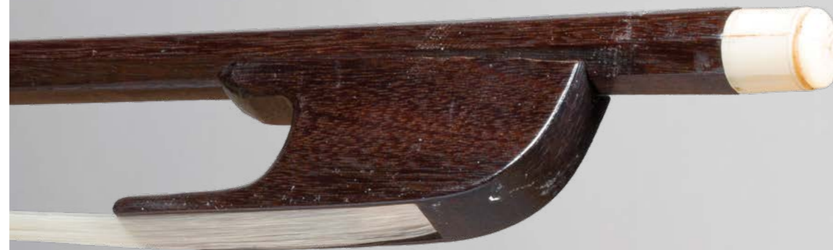
N° 39 Rare archet de violon de François-Xavier TOURTE Fait vers 1765-1770. 46g6. Très bon état. Figure dans le livre « L'Archet Révolutionnaire (1700-1800) », tome I, page 36, n° 17.