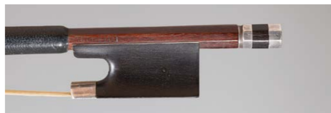
N° 42 Archet de violon de Charles Nicolas BAZIN Fait vers 1890, signé « Lupot », monté argent. 60g4. Bon état.