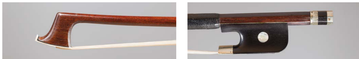
N° 14 Archet de violon de Claude Charles Nicolas HUSSON Fait vers 1860, monté maillechort. 62g5. Bon état.