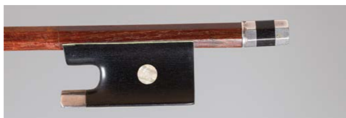
N° 7 Rare archet de violon de Claude Charles Nicolas HUSSON Fait vers 1850, signé « Husson », monté argent. 49g8. Très bon état. Figure dans le livre « L'Archet », tome II, page 328, n° 1.