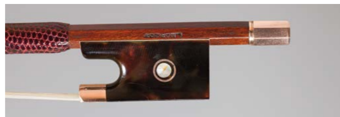
N° 40 Rare archet de violon de Louis Joseph MORIZOT Père Fait vers 1935, signé « L. Morizot », monté écaille et or. 62g1. Très bon état. Figure dans le livre « L'Archet », tome III, page 173, n° 10.