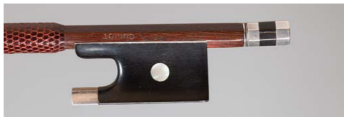
N° 37 Archet de violon de Pierre CUNIOT Fait vers 1880, signé « Cuniot », monté argent. 49g7. Très bon état. Figure dans le livre « L'Archet », tome II, page 437, n° 9.