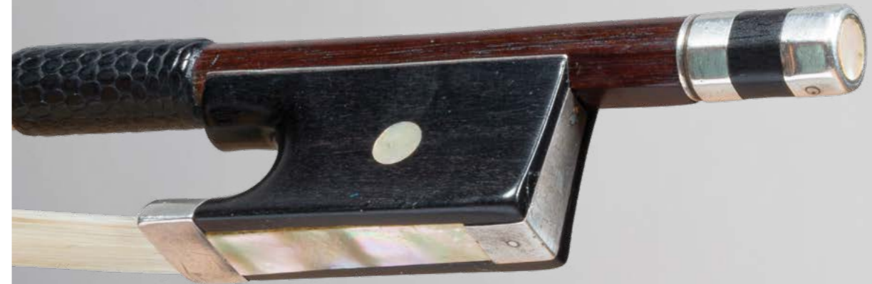
N° 45 Très bel archet de violon d'Etienne PAJEOT Fait vers 1840, monté argent. 61g. Bon état.