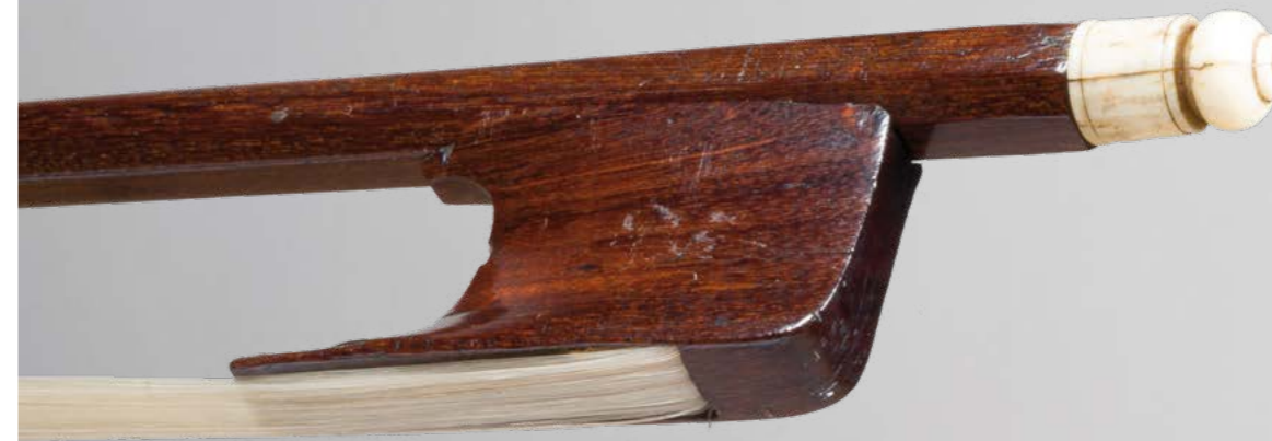
N° 17 Rare archet de violon de Nicolas Pierre TOURTE Fait vers 1750-1760. 45g8. Bon état. Figure dans le livre « L'Archet », tome I, page 53, n° 2.