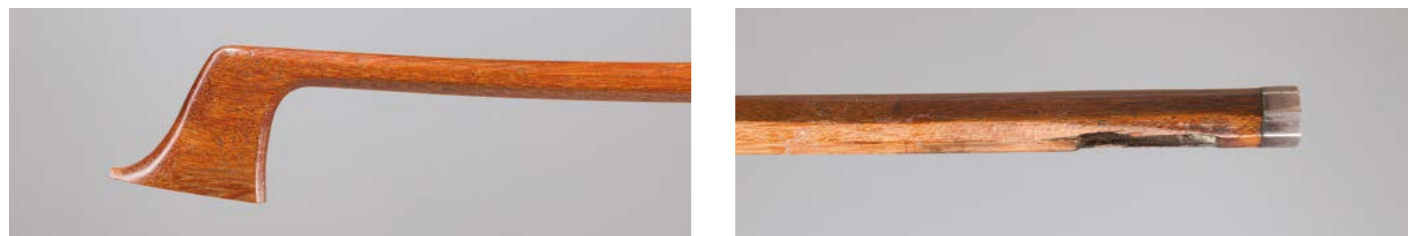
N° 12 Belle baguette d'archet de violoncelle de François-Xavier TOURTE Fait vers 1825. 37g7. Bon état.