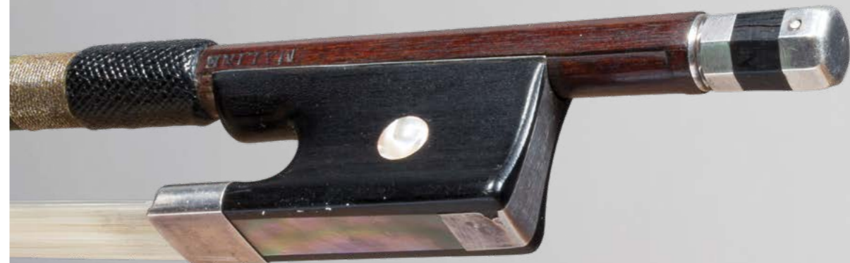
N° 11 Très bel archet de violon de Nicolas MALINE Fait vers 1855, signé « Maline », monté argent. 60g6. Très bon état. Figure dans le livre « L'Archet », tome II, page 286, n° 6.