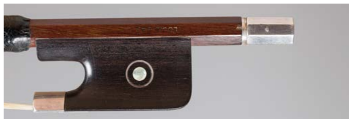
N° 9 Très bel archet de violoncelle de Joseph THOMASSIN (cousin germain de Charles Nicolas Bazin) Fait vers 1930, signé « Louis Bazin », monté argent. 81g4. Très bon état. Figure dans le livre « L'Archet », tome III, page 254, n° 9.