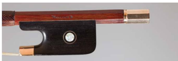
N° 28 Rare archet de violoncelle de Louis Joseph MORIZOT Père Fait vers 1930, signé « E. Pouzol », monté or. 72g2. Très bon état. Figure dans le livre « L'Archet », tome III, page 171, n° 5.