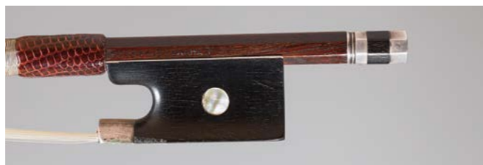
N° 34 Archet de violon de Louis Joseph THOMASSIN Fait vers 1895, signé « Thomassin à Paris », monté argent. 55g3. Très bon état. Figure dans le livre « L'Archet », tome III , page 45, n° 6.